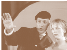
Den fyrste song: Christian Greger og Ane Dahl Torp