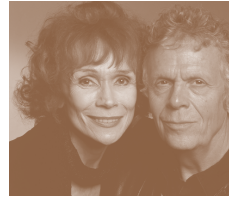
Det er sant hvert evig ord: Monna Tandberg og Lars Andreas Larssen

Medverkande: Monna Tandberg Lars Andreas Larssen