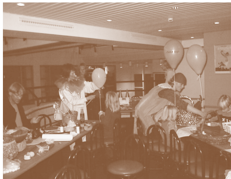
... barnlige lyst