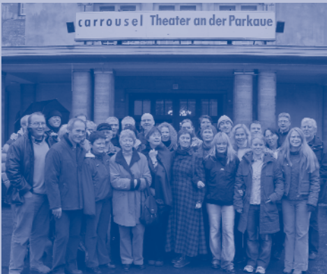
De tilsette på gjestespel til Tyskland